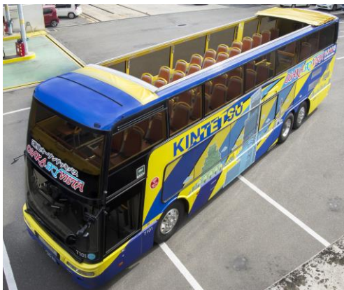
OSAKA SKY VISTA