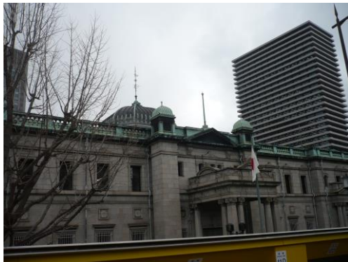
日本銀行大阪支店