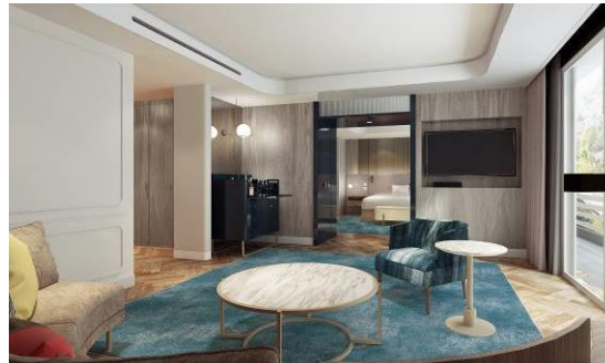
本館 ラグジュアリースイート リビングルーム(イメージ)