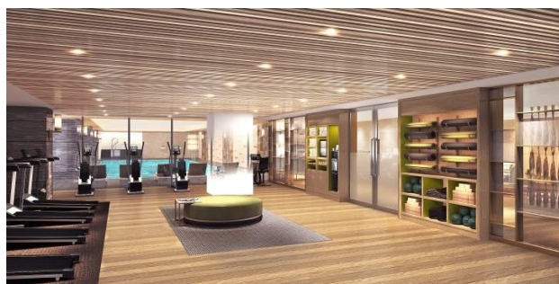
(フィットネススタジオ イメージ)

また、ウェスティン独自のプログラム「GEAR LENDING」により、かさばるスニーカーやフィットネスウェアをお持ちいただくことなく、普段通りのエクササイズをお楽しみいただけます。(レンタル用品は一部有料)