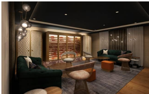
種類豊富なシャンパンをそろえたシャンパンラウンジ