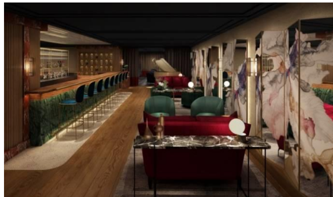
深くつろぎを生むグリーンをベースにしたインテリアが印象的なバー。