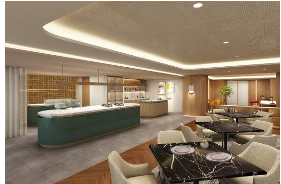
(クラブラウンジ「Westin Club」内 イメージ)