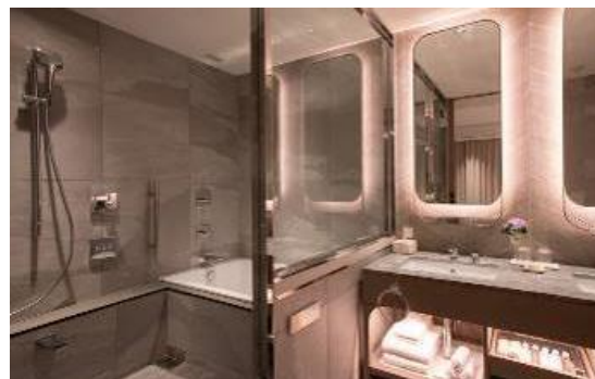
全室洗い場付き浴室(東館、本館共通)