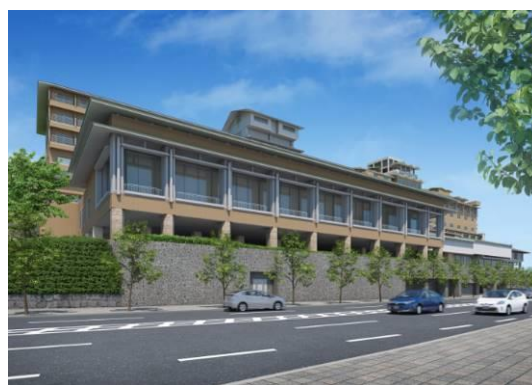
三条通からの外観。京都・東山の景色が一望できる。