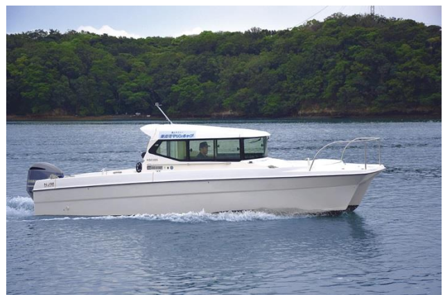
英虞湾マリンキャブ