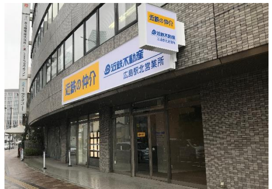
【広島駅北営業所 外観】

名称：近鉄の仲介 広島駅北営業所 所在地：広島県広島市東区若草町9番7号 （三共若草ビル1階） 交通：JR広島駅（新幹線口）徒歩6分 営業開始日：2019年8月3日（土） 営業時間：9：30～18：20 定休日：水曜日および木曜日 問合せ：TEL：082-567-2121 FAX：082-567-6000 フリーコール：0120-901-152 E-mail：e-ekikita@kintetsu-re.co.jp