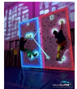
ARボルダリングイメージ

今回のMR卓球を体験する商品の販売に続き、今後も最先端の技術を活用したスポーツ競技の新たな体験価値を提供してまいります。