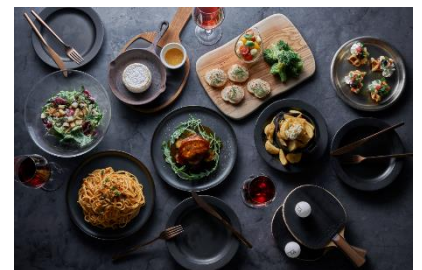
ディナーイメージ MR卓球をご体験いただいた後、 ゆっくりご夕食をお楽しみください。

JR 渋谷駅 ハチ公口徒歩6分、東京メトロ・東急東横線 渋谷駅 13番出口より徒歩5分