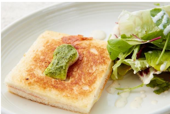
古墳クロック・ムッシュ