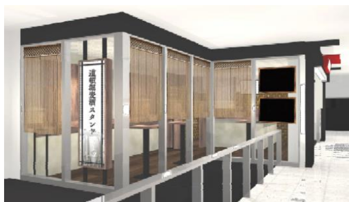
《道頓堀麦酒スタンド》