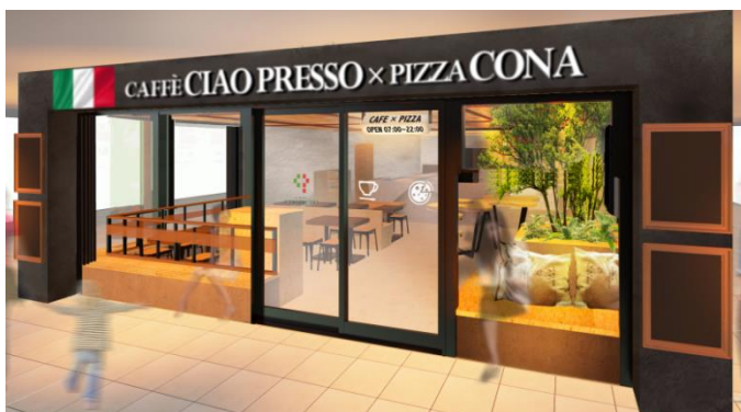
《CAFFE CIAO PRESSO × PIZZA CONA》