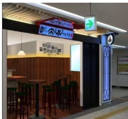
《小皿鉄板酒場 グリル千本》