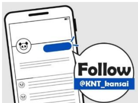
①KNT関西のアカウントをフォロー