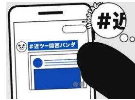
③ハッシュタグ「#近ツー関西パンダ」をつけて投稿!

【キャンペーン概要】 https://www.knt.co.jp/meito/sp/nanki_cpn/?utm_source=hdpress&utm_medium=referral&utm_campaign=20190614