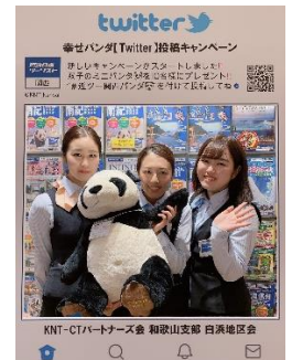
Twitter 投稿イメージ写真

白浜古賀の井リゾート&スパ、ホテル川久、白浜シーサイドホテル、ホテルフリーゲート白浜、紀州・白浜温泉むさし、白良荘グランドホテル、温泉三昧の宿白浜館、癒しの宿クアハウス白浜、ホテル三楽荘、SHIRAHAMA KEY TERRACE、ホテルシーモア、浜千鳥の湯 海舟、ホテル天山閣海ゆう庭、INFINITO HOTEL&SPA 南紀白浜、ホテルハーヴェスト南紀田辺、ホテルベルヴェデーレ、下御殿、観光旅館 萬屋、季楽里龍神、HOTEL&RESORTS WAKAYAMA MINABE