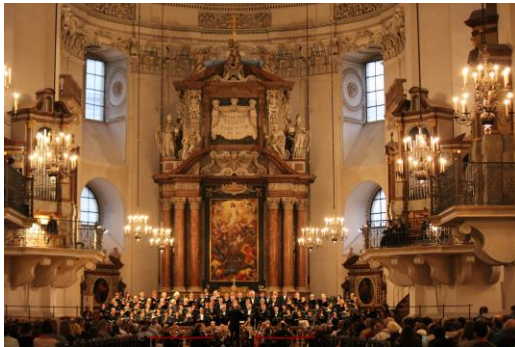
ザルツブルク大聖堂での公演の様子

https://www.club-t.com/theme/classic/kaigai/salzburg.htm