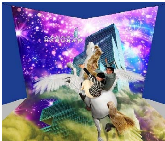
トリックアートイメージ

※併設のドラッグストア「コクミン」では、近鉄百貨店と共同で、通常のドラッグストア商材だけでなく、美容家電や調理家電、ハローキティグッズ等海外からのお客様に人気の日本製品も販売します。