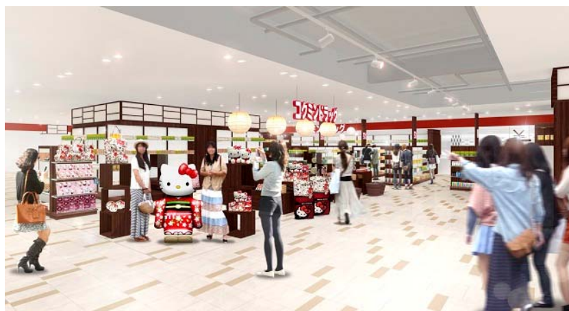
©1976, 2015 SANRIO CO., LTD. APPROVAL NO.S560012