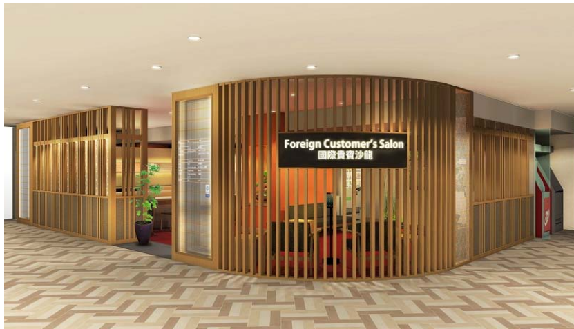
フォーリンカスタマーズサロン《サービスサロン》外観イメージ

「フォーリンカスタマーズサロン」は、 免税手続きや手荷物預かり等のサービスを提供する「サービスサロン」と、日本ならではの体験等ができる「体験サロン」の異なる機能を持つ2つのサロンから成ります。 サロンには、盆栽・玉砂利・つくばい等を配して“和”を感じていただける空間とし、海外からのお客様に利便性の高いサービスと、くつろぎのスペースをご提供いたします。さらにドラッグストア「コクミン」を併設させ、人気の高い日本製品やドラッグ商材、コスメ商材の販売も併せて強化してまいります。