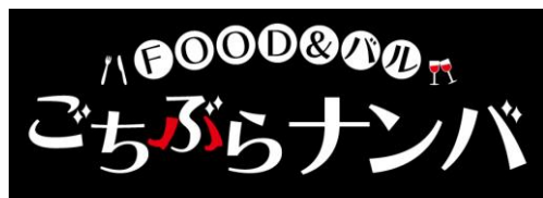
◀「ごちぶらナンバ」ロゴマーク▶