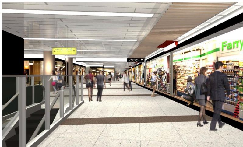
◀リニューアル工事後の駅構内、モールイメージ▶