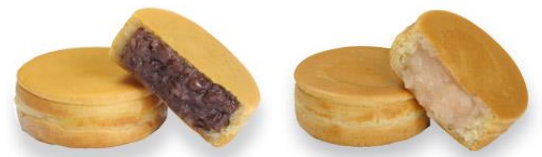
≪御座候商品イメージ≫