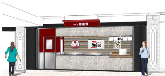
◀「御座候近鉄なんば店」▶

「御座候近鉄なんば店」と「モール内装のリニューアルイメージ」、「ごちぶらナンバ」ロゴマークの詳細は別紙のとおりです。