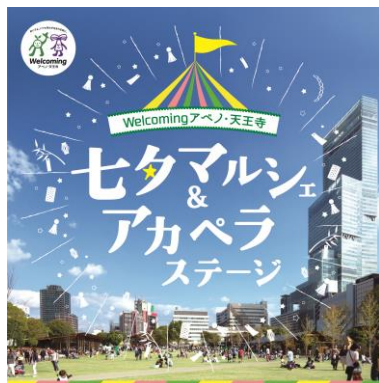
七タマルシェ&アカペラストージ キービジュアル