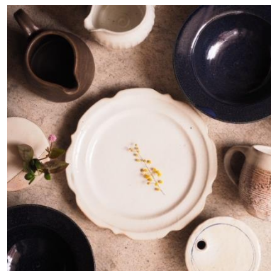
アベノのお店 カタルテ