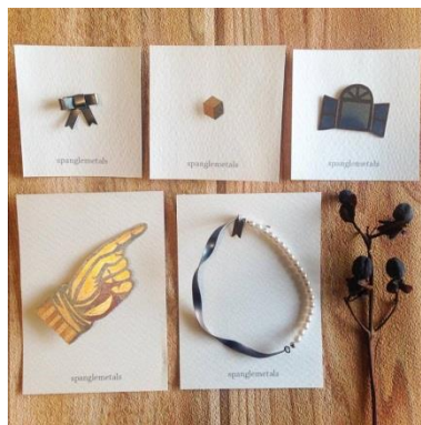
天王寺のお店 きになる舎