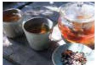
阿倍野のお店 ⑤ 十十十十 (サササ) [漢方茶、原石装身具]