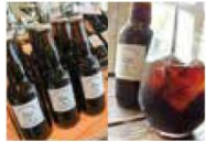
天王寺のお店 ③ The Coffee Market [クラフトコーヒー、ドリップバック、コーヒー豆]