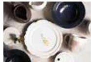
阿倍野のお店 ④ 器と暮らしの雑貨カタルテ [陶芸家の手仕事の器]