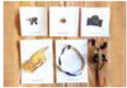
天王寺のお店 ② きになる舎 [アクセサリー、雑貨、オリジナルティーバッグ]