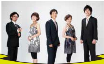
プロデュース Be in Voices

会場内のライブスペースでアカペラストージを開催！ マルシェを楽しみながら、アカペラが響く街を体感！