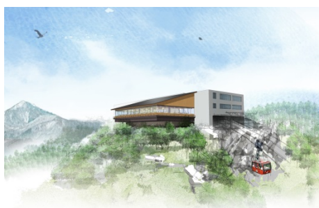
【展望レストラン 外観イメージ】