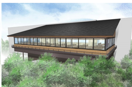
「ナチュラル」フランス語で自然の意