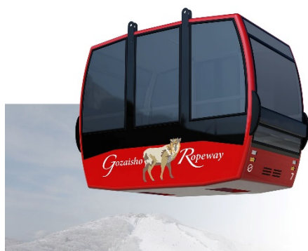
【新型ゴンドラ 外観イメージ】

(4) 運行 約4分毎に新型ゴンドラを配置（4両に1両が新型） *ゴンドラの総数は36両、うち新型10両・現行26両