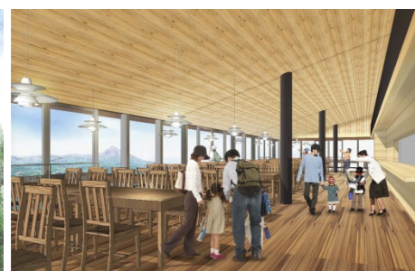
【展望レストラン 内観イメージ】