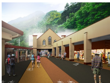
山麓駅前 リニューアル 【外観イメージ】