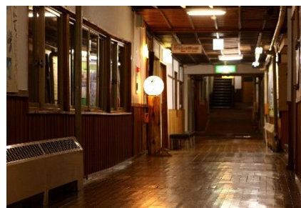
酸ヶ湯温泉旅館 ヒバ千人風呂(左) 館内の様子(右)

「酸ヶ湯温泉旅館」は昔ながらの素朴な風情を残す八甲田山の一軒宿で、「秘湯」と称される温泉を楽しもうと、連日多くのお客様が訪れています。ところが、名物の「ヒバ千人風呂」は通常は混浴のみとなっています。そのため、「興味はあるが混浴には抵抗がある」と訪問を躊躇う方も多く、当社のお客様からも同様の声をたくさんいただいております。