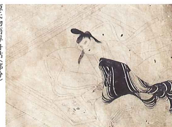
源氏物語浮舟帖(部分)

特別展 白描の美 — 図像・歌仙・物語 — 平成29年1月6日(金)～ 2月19日(日)まで 休館日: 毎週月曜日(祝日の場合翌平日)