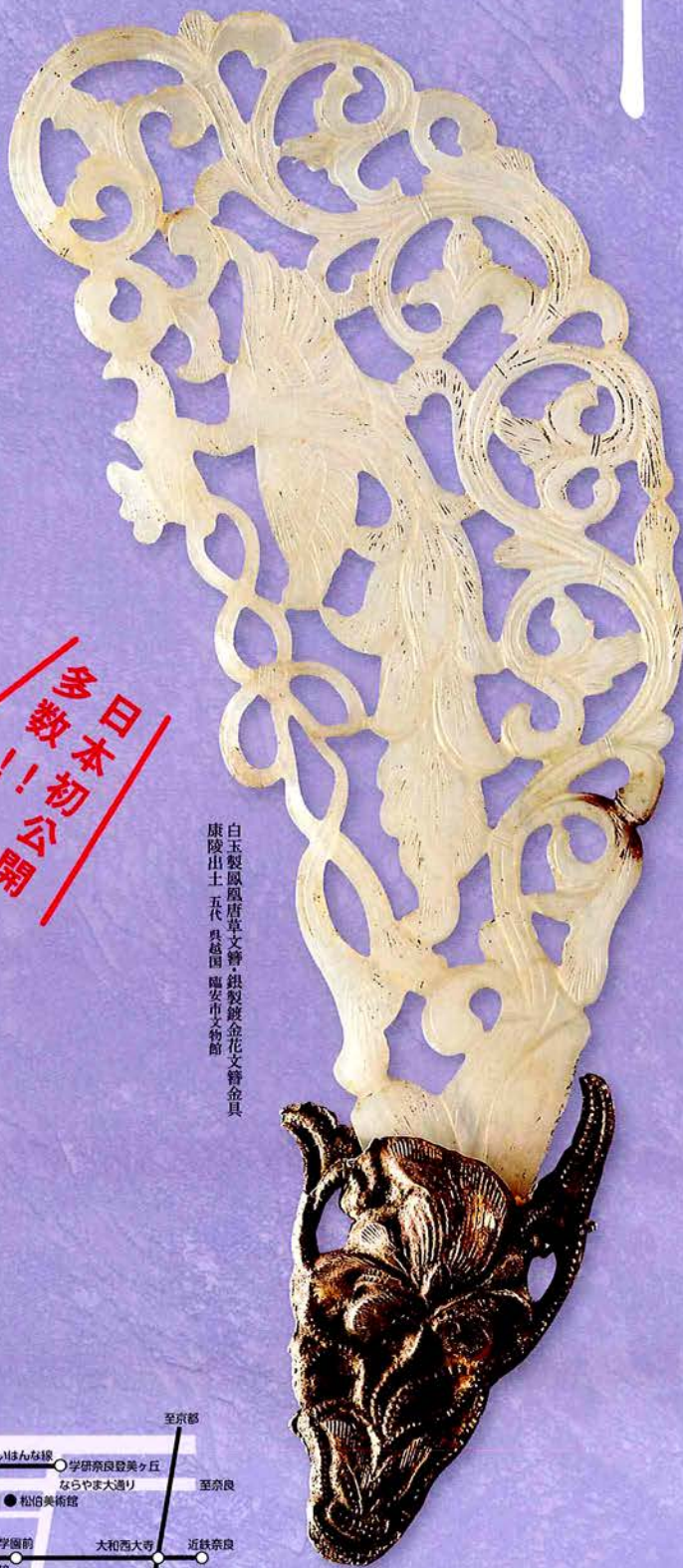
白玉製鳳唐草文簪 銀製鍍金花文簪金具 康陵出土 五代 呉越国 福安市文物館

呉越国(907-978年)は十世紀に中国の江南に位置し、越窯青磁や金銀器など美術・工芸において高い技術を持つ一方で、仏教を篤く信奉し、東アジアにおける文化交流に大きな役割を果たしました。建国から北宋に降るまでのわずか約七十年の間に輝きを放った呉越国の文化を、仏教美術や工芸品を通して浮き彫りにします。