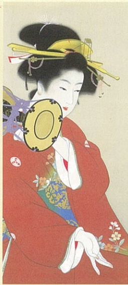
上村松園「鼓の音」(部分)昭和15年 松伯美術館蔵