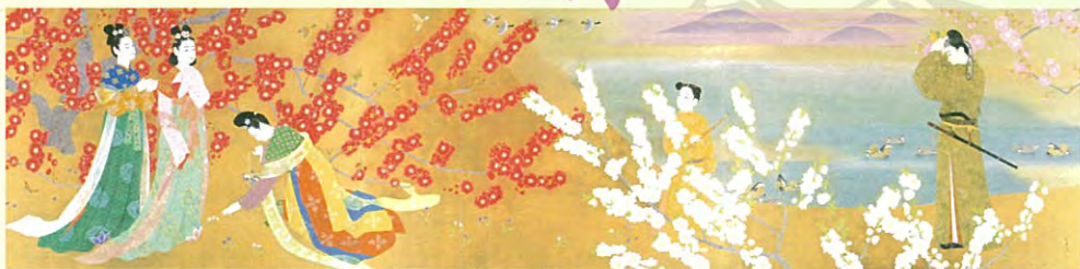
上村松篁「万葉の春」昭和45年(前期) (近鉄グループホールディングス株式会社蔵、松伯美術館管理)