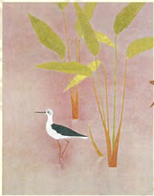
上村淳之「秋光」平成18年(後期)