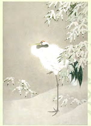
上村松篁「丹頂」昭和55年(前期)