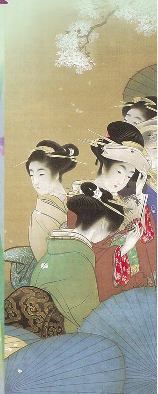
上村松園「花見」(部分)明治43年