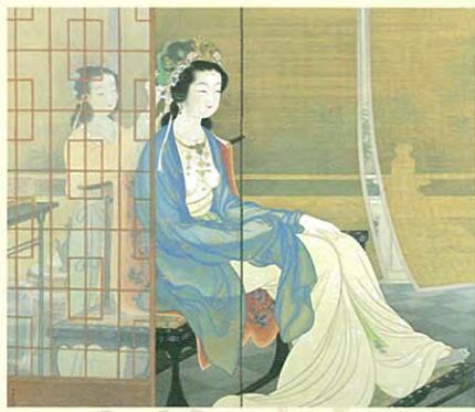
上村松園「楊貴妃」大正11年(後期)