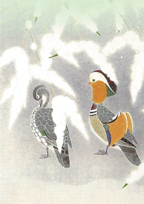
上村松篁「春雪」(部分)昭和57年