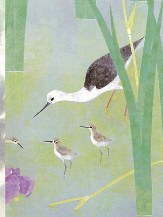
上村淳之「花の水辺Ⅱ」(部分)平成19年