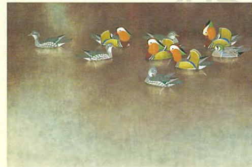
上村松篁「鴛鴦」昭和40年(後期)