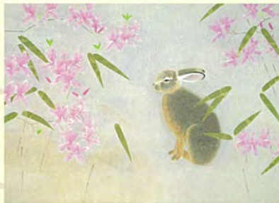
上村松篁「春静」昭和58年(前期)