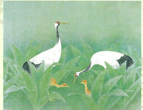
上村淳之「釧路湿原の春」平成20年(前期)