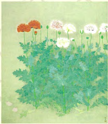
上村松篁「芥子」昭和62年(後期)