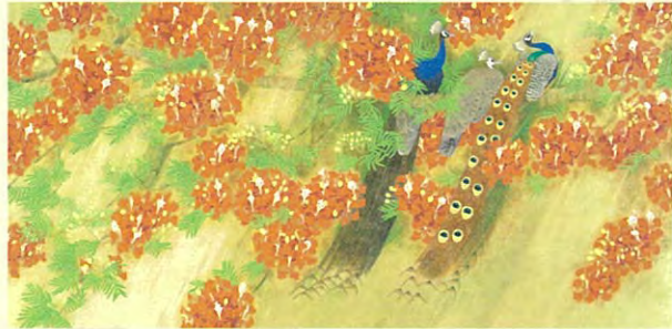
上村松篁「雉雨」昭和47年(後期)