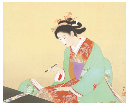
美人詠哥(吉野石膏コレクション) 当館初展示