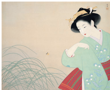
新蛭(東京国立近代美術館蔵)