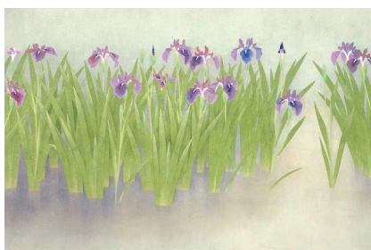
杜若(神奈川県立近代美術館蔵)