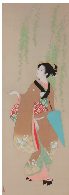
春さめ(大分県立美術館蔵) 当館初展示