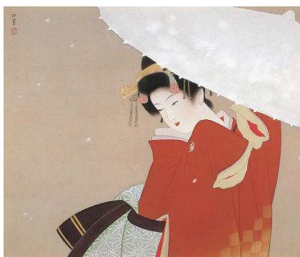
初雪(大川美術館蔵) 当館初展示