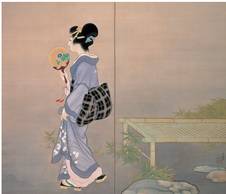
上村松園 月蝕の宵(大分県立美術館蔵) 当館初展示

「文化勲章 三代の系譜 上村松園・松篁・淳之」展は、 京都(京都高島屋S.C.)、東京(日本橋高島屋S.C.)、松伯美術館の三会場で開催。 松伯美術館では、2024年5月18日(土)から7月15日(月・祝)までの会期で 開館30周年記念特別展として開催します。