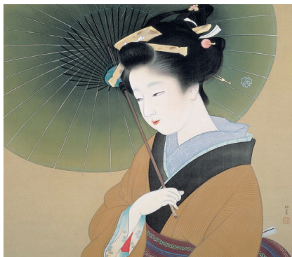
青眉(吉野石膏コレクション)