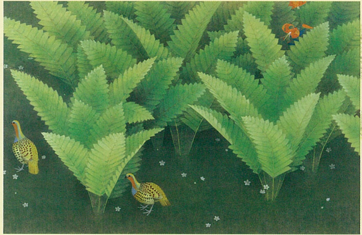
上村松篁「草原八月」昭和31年