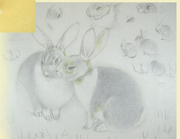
(図版で表記のないものはすべて松伯美術館所蔵)

松伯美術館 友の会 会員を募集しております。 皆様のご入会をお待ち しております