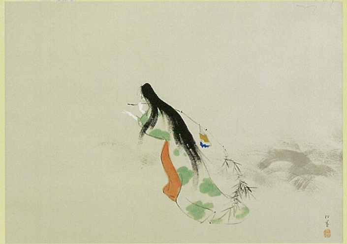
上村松園「暮秋」昭和18年