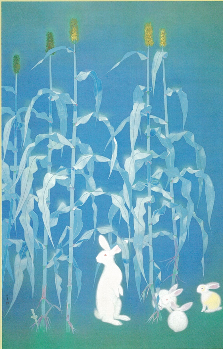
上村松篁「月夜」昭和14年