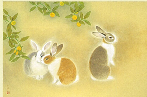
上村松篁「兔1」昭和62年(右下:「ウサギ写生部分」)