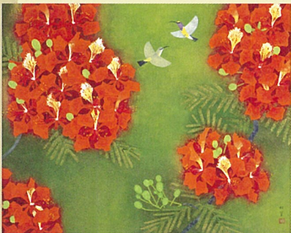
上村松篁「鳳凰木」昭和48年