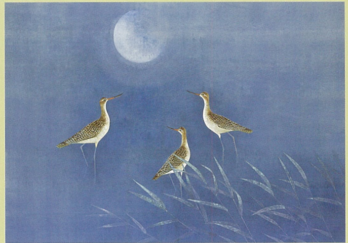
上村淳之「憩」平成15年