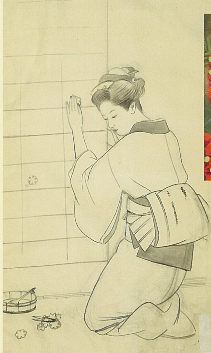
上村松園「晩秋(下絵)」昭和18年