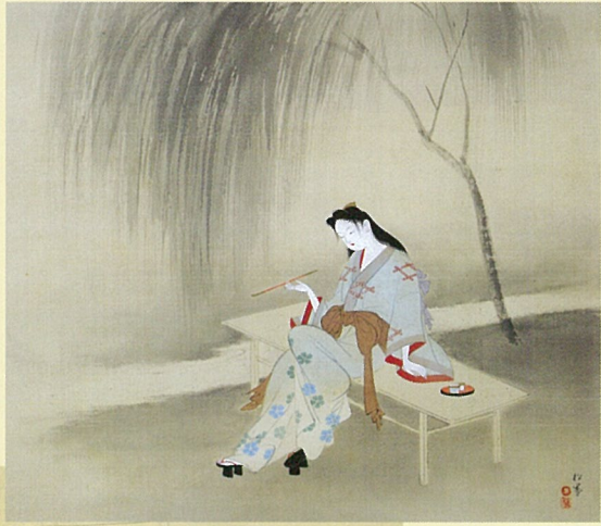
上村松園「美人納涼」昭和7年