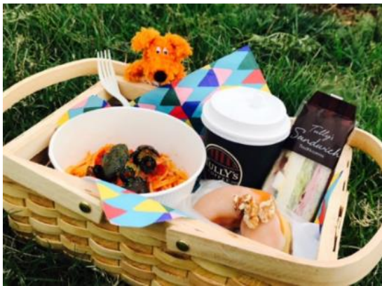
【①タリーズコーヒー】