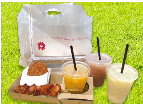
【③産直市場 よってって】