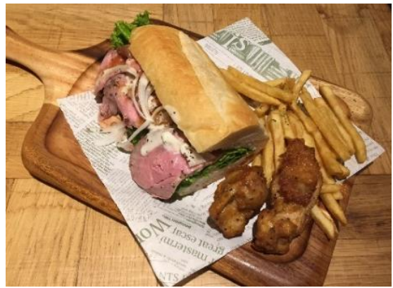
【②ソライロキッチン イン てんしばパーク】