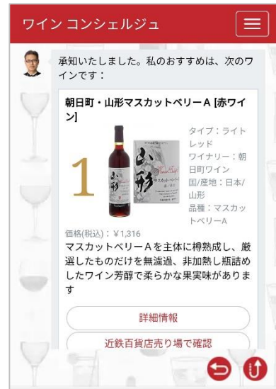
商品提案画面イメージ