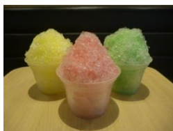
ロッターリアかき氷 (イメージ)