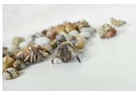
アルバトロス オカヤドカリつり (イメージ)