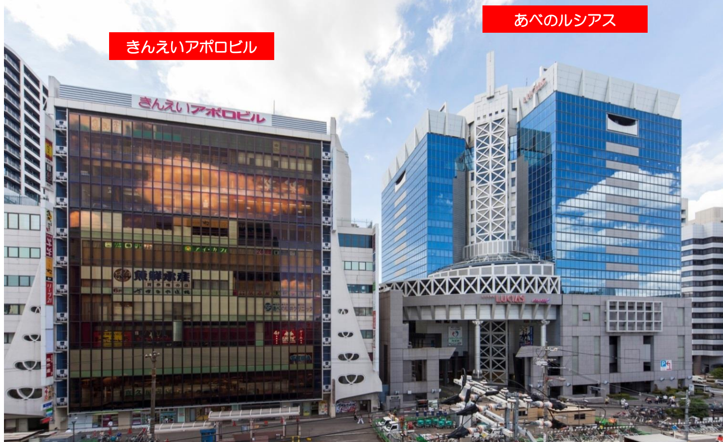
きんえいアポロビル

シネマ、グルメ、ショッピング、サービス、フィットネス、大型書店等約110店舗が揃った大型商業ビル