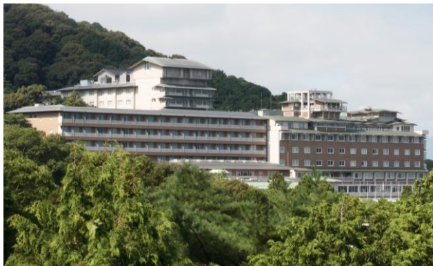
THE WESTIN MIYAKO KYOTO