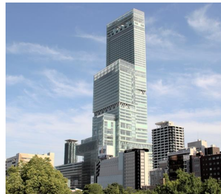
MARRIOTT OSAKA MIYAKO