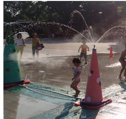
水のあそびば イメージ