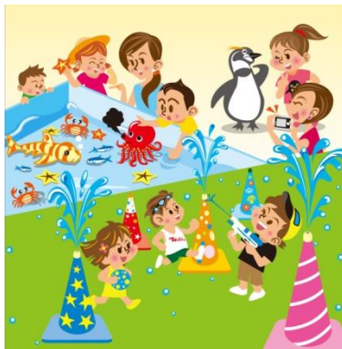
アベノ・天王寺で水あそび！ イメージイラスト