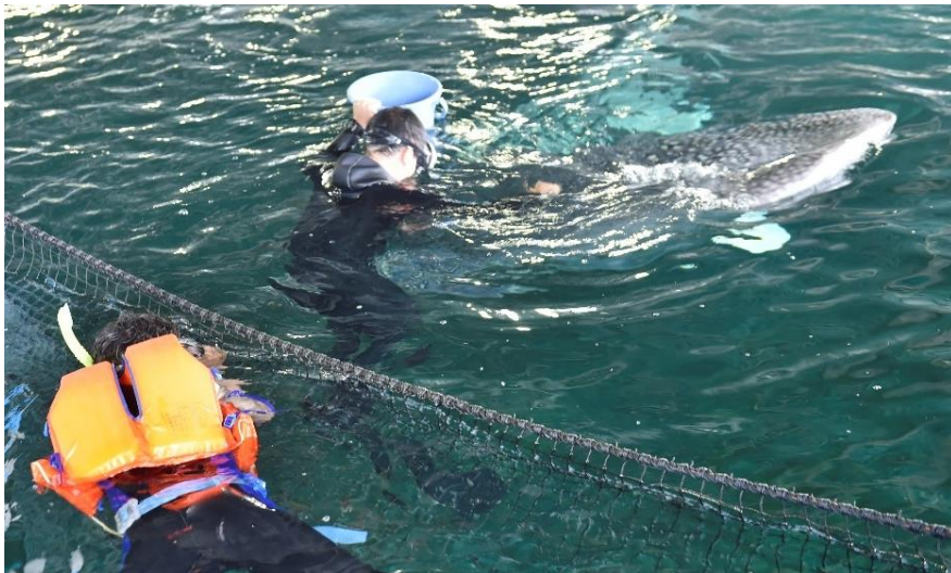
ジンベエザメの健康管理トレーニング 見学（イメージ）

今回のテーマは「研究と自然観察」。高知県土佐清水市にある「大阪海遊館海洋生物研究所 以布利センター」でジンベエザメの水槽に入って健康管理トレーニングを間近に観察（同施設では初めての取り組みとなります。）したり、漁港に水揚げされた魚類の観察や、海岸で生き物や漂着物を探したり、飼育員が企画したプログラムを通して、太平洋に面した高知県の豊かな自然や海と生き物の面白さを体感していただきます。家族や友人とのグループ参加はもちろん、大人 1 名の参加でもお楽しみいただけます。