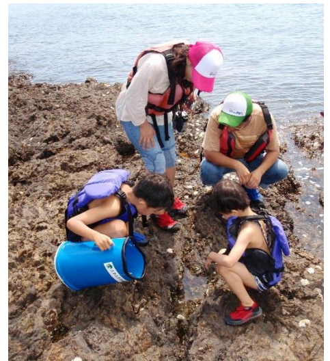
以布利海岸での自然観察（イメージ）

本スクールは海遊館が企画し、近鉄グループの近畿日本ツーリスト関西が旅行企画・実施します。