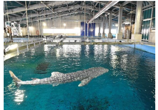
（以布利センター 第2水槽）

名称：大阪海遊館海洋生物研究所 以布利センター 設立：平成9年9月24日 所在地：高知県土佐清水市以布利 運営：株式会社海遊館 主要設備：第1水槽 円形（直径約20m、水量1,600t） 第2水槽 長方形（約19m×約31m、水量3,300t） 健康管理用プール（約8m×約8m）を併設