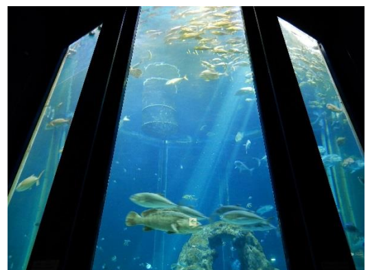
（足摺海洋館 海洋水槽）

名称：足摺海洋館 設立：1975年5月 所在地：高知県土佐清水市三崎字今芝4032 運営：株式会社高知県観光開発公社 営業時間：4月～8月 8:00～18:00 9月～3月 9:00～17:00 ※12月第3木曜日休館 料金：大人720円 児童・学生（小・中・高校生）360円 乳幼児無料