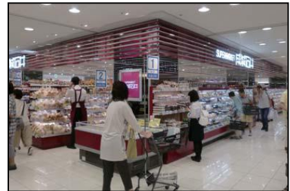
成城石井近鉄四日市店