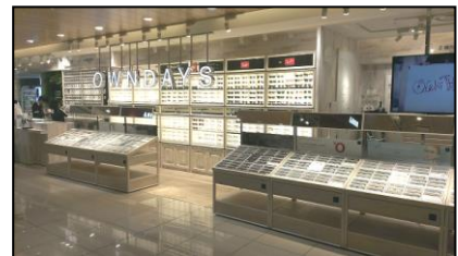
オンデーズあべのハルカス店