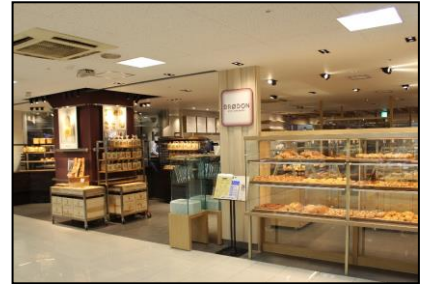
ブロッドン近鉄四日市店