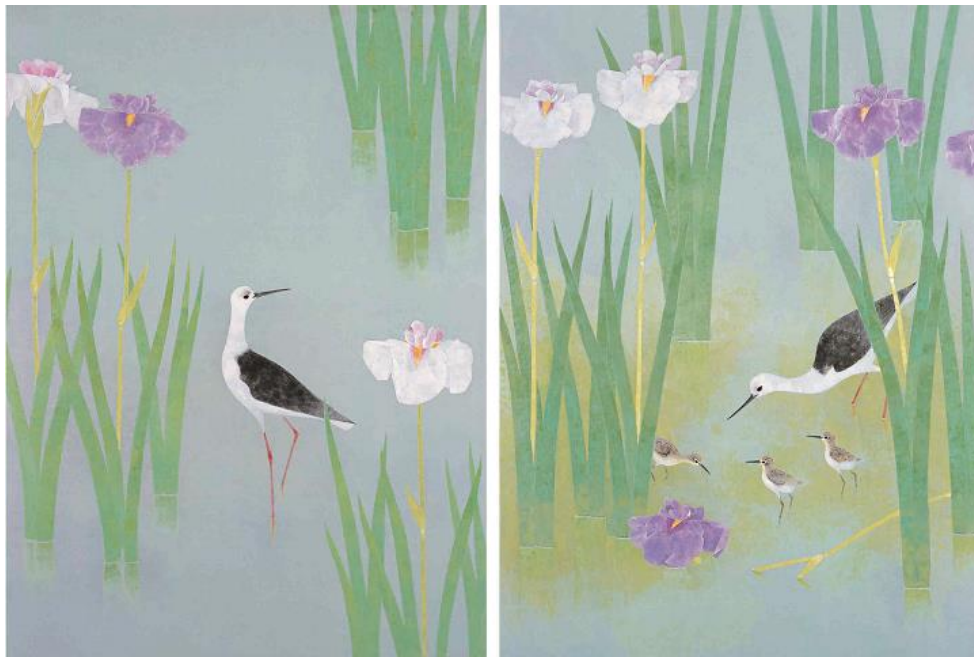
上村淳之「花の水辺Ⅰ・Ⅱ」