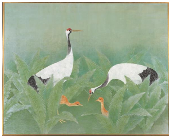
上村淳之「釧路湿原の春」