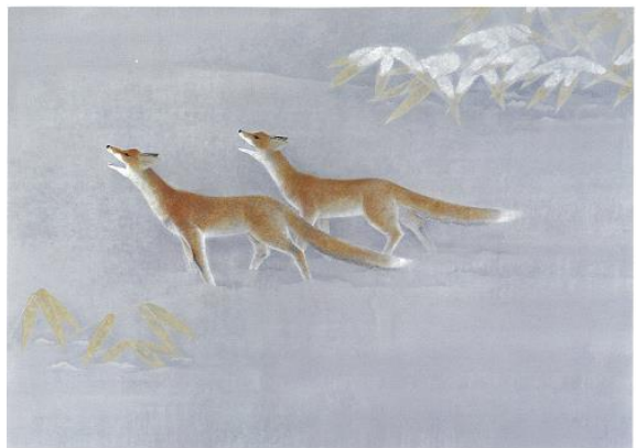
上村淳之「初めての冬」