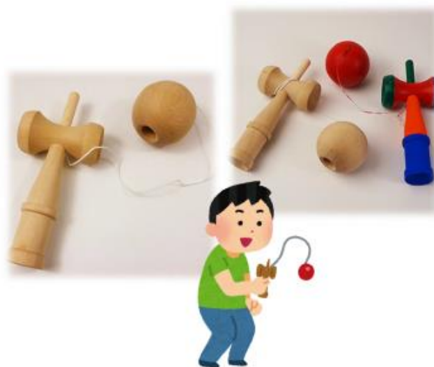
【昔あそびイメージ】