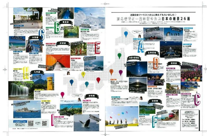
1月号表紙と特集ページ

「S Cawaii！」2018年1月号では、「真のキラキラ女子になるイベント特集号」というテーマで、さまざまな企画が展開されます。そのひとつとして、1月～3月の卒業旅行シーズンを迎えるにあたり、「～卒業旅行の参考に～『キラキラ女子のための週末旅行』」として、旅にまつわる様々な特集が組まれています。