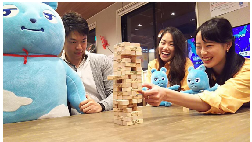
交流イベントの様子（イメージ）