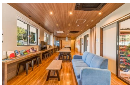
ゲストハウス交流スペース