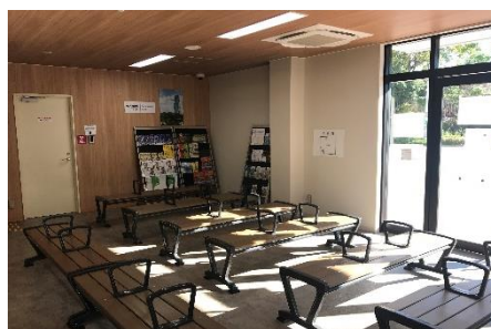
国際観光案内所・バス待合所