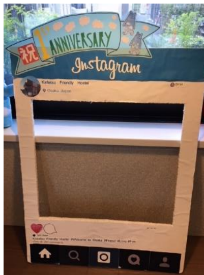
「開業1周年ガラボン」インスタボード