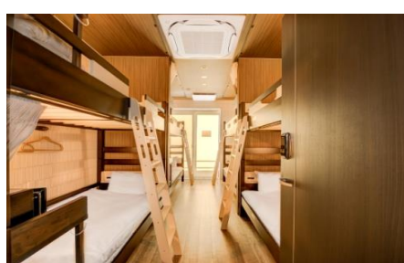
ゲストハウスルーム