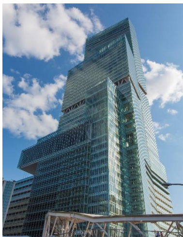
【日本一高いビル「あべのハルカス」】