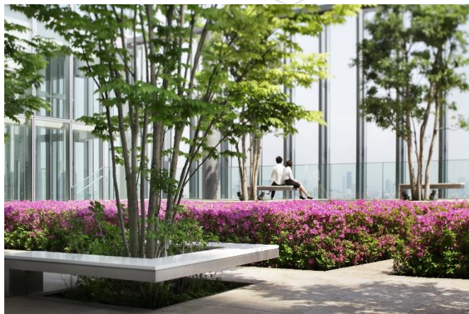
【上：セットバックおよび庭園位置 概念図 下：16階庭園】