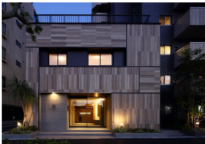
【ローレルコート西葛西】