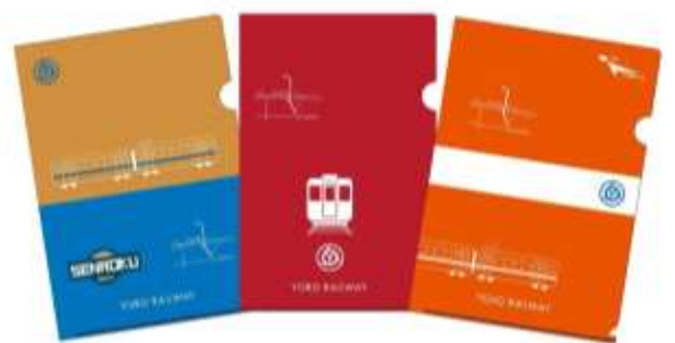
(参考) 養老鉄道クリアファイル