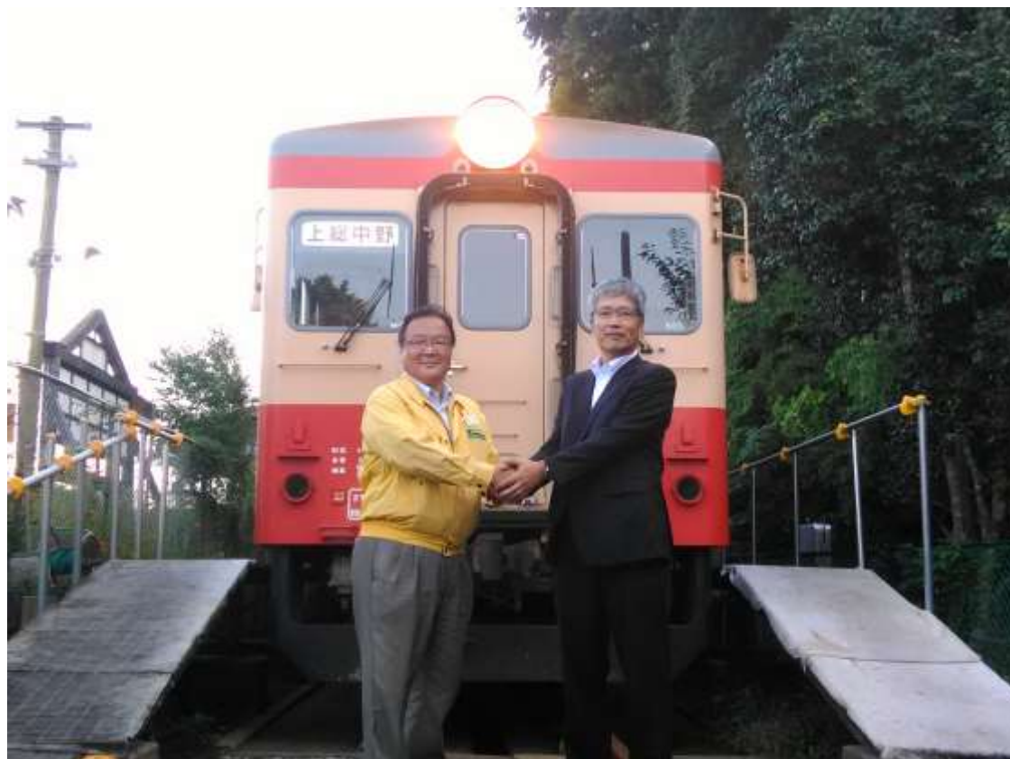
いすみ鉄道・鳥塚社長（左）と養老鉄道・都司社長（右）