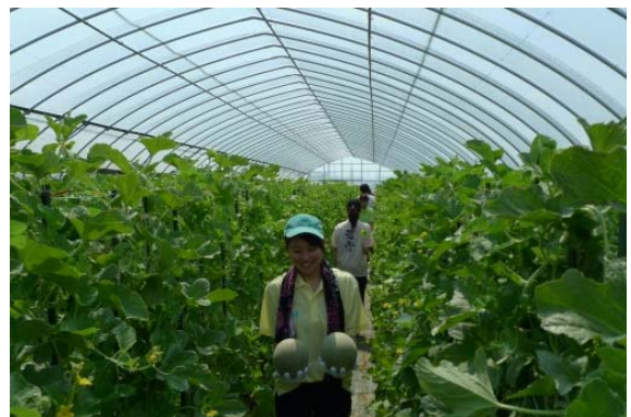
近畿大学農学部学生による「バンビーナ」の収穫風景