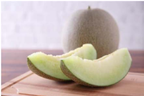
近畿大学農学部と(株)松井農園が共同開発した「バンビーナ」