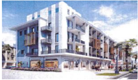
【低層棟イメージパース】