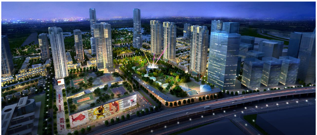
【TMCPプロジェクト全体イメージパース（夜景）】

※TMCPプロジェクト・・・90haにわたる計画面積であり、政府による一体整備が計画されている公園の面積100haを加えると、ハノイ最大の不動産事業となります。分譲住宅開発においても低層棟約1,000戸、高層棟17棟・約7,700戸と最大規模の計画です。