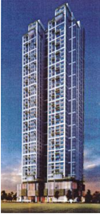
【高層棟イメージパース】