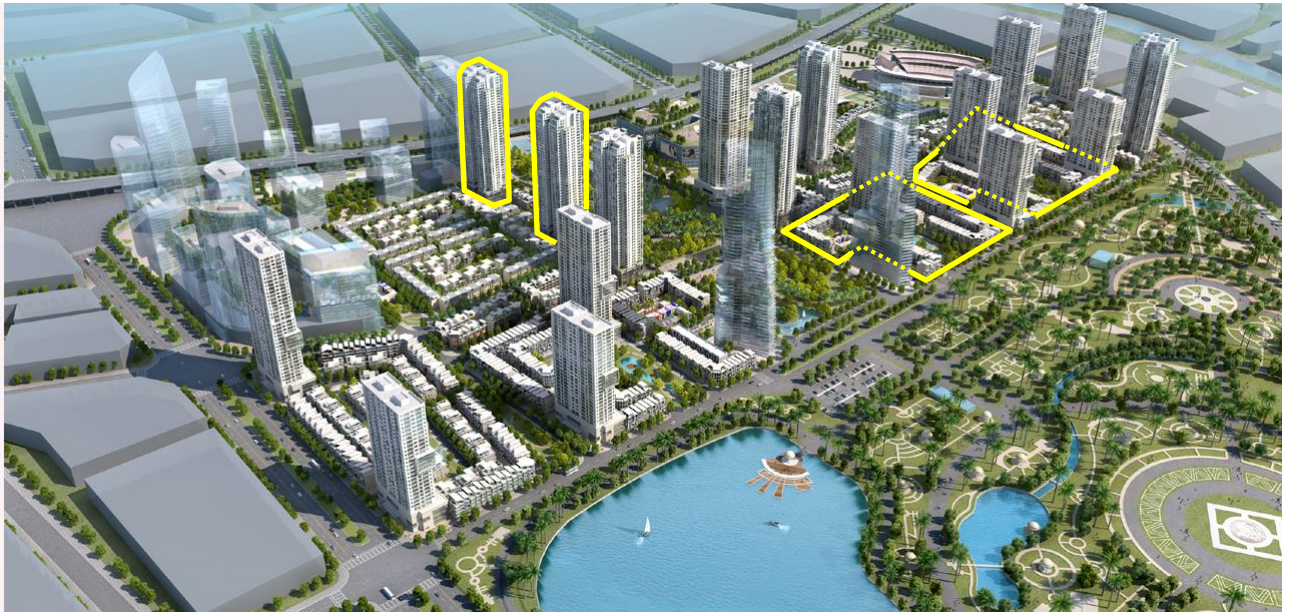
【TMCPプロジェクト全体イメージパース】