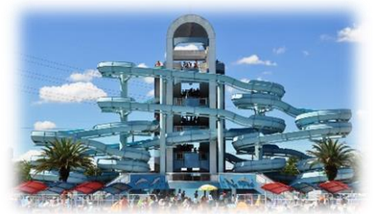
<橿原市総合プール>