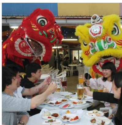
アポロスカイピアガーデン2017