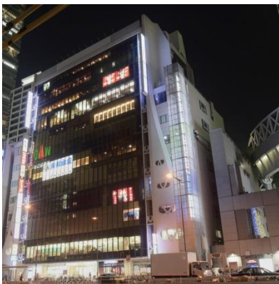
きんえいアポロビル外観