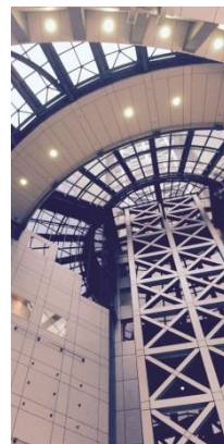
ルシアスのガレリア