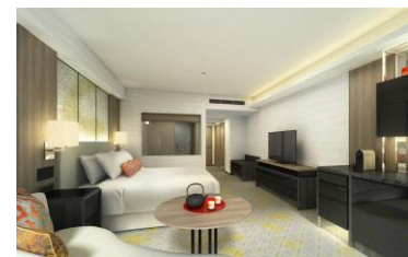
デラックスルーム (イメージ)

志摩観光ホテルのバスアメニティとしても人気の、日本ブランド「ミキモト コスメティクス」のオリジナルアメニティ、モイストプラスシリーズ。超純水を使用し、マグノリア・ローズ・ベルガモットを中心とした“インペリアルパール”の華やかで優雅な香りをお楽しみください。(シャンプー、ヘアトリートメント、ボディソープ、ボディトリートメント)