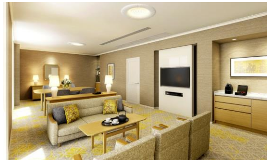
ミヤコスイート (イメージ)