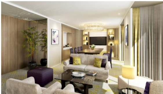
シロカネスイート (イメージ)

ミヤコスイート(96㎡)：開業当時の内装を手掛けた建築家 村野藤吾のインテリアを継承し、客室全体を落ち着いた色彩で仕上げました。