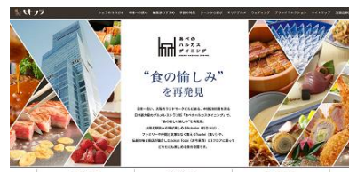
タワー館 14F Kokon Tozai(古今東西)