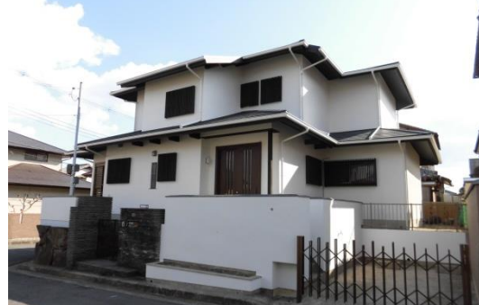
【リノベーション後 外観写真】