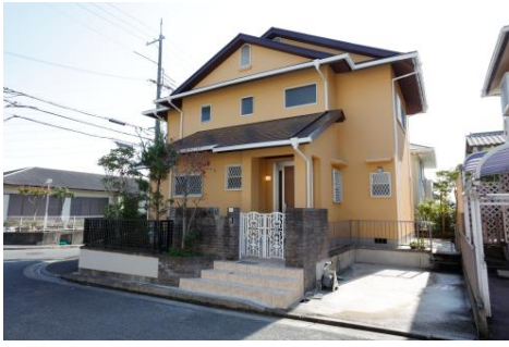
1. 近鉄のリノベーション戸建プロジェクト 白庭台 (2015年11月)