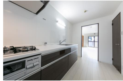
5. 近鉄のリノベーションマンション プロジェクト ローレルコート エスタ高の原 (2017年2月) ※1988年 当社分譲物件