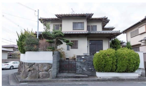
【リノベーション前 外観写真】