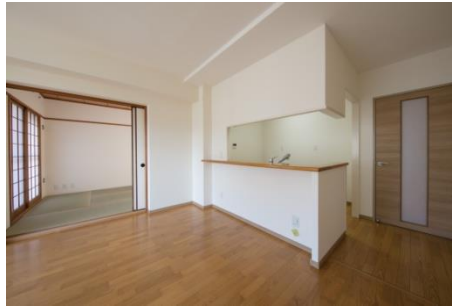
4. 近鉄のリノベーションマンション プロジェクト 木津かぶと台団地 (2017年2月)