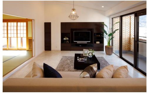
2. 近鉄のリノベーションマンションプロジェクト レフィナード東生駒 (2016年2月) ※1984年 当社分譲物件