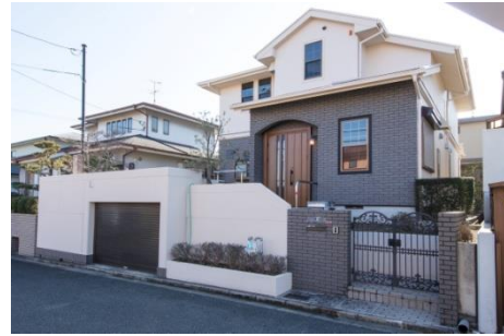
3. 近鉄のリノベーション戸建プロジェクト 精華桜ヶ丘 (2017年2月) ※1993年 当社建築物件 (注文住宅)