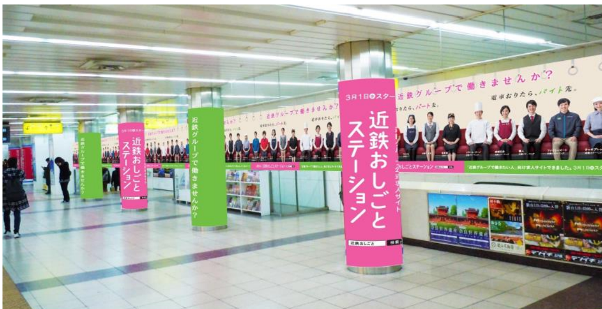
（※写真は大阪難波駅のイメージです）

平成29年3月1日（水）から近鉄の駅交通広告等を活用した広告宣伝を展開します。また、大阪難波駅では、3月6日（月）から駅をジャックした集中PRも実施します。