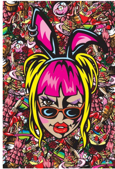
レーザーラモンHIGさんの作品例