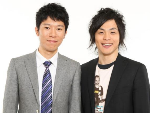
モンスターエンジン