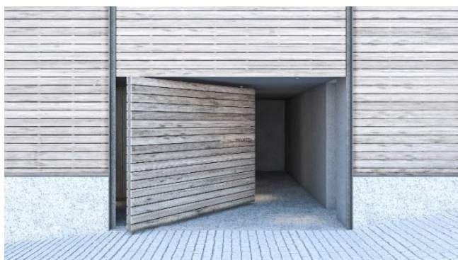
エントランスイメージ(リノベーション後)

当社は、今後も築年数の経過した物件を再生するリノベーション賃貸レジデンス事業を積極的に推進していきたいと考えています。詳細は別紙のとおりです。