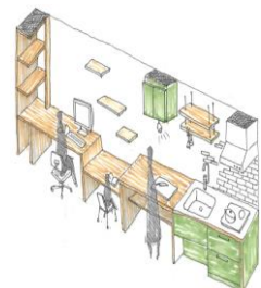
キッチン一体型ワークスペースイメージ