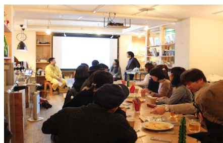
コモンスペース使用例（イメージ）

コミュニケーション不足になりがちな都会の单身生活において、情報の交換やライフスタイルの共有ができる場所を1Fに設置します。室内には共用のキッチンと高級家電、スクリーンやプロジェクター、フリーwi-fiなどを備え、住民同士の普段使いだけでなく、友人を招いたホームパーティ等にも利用可能です。また、入居者同士がスムーズに交流しあえるよう、当社主催の「入居者交流会」を開催することも計画しています。