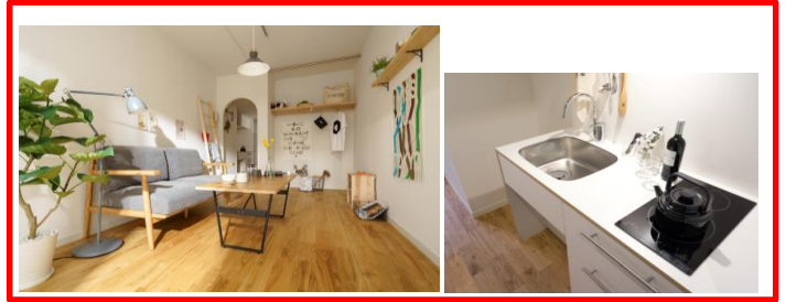
リノベーション後（棟内モデルルーム<アーチタイプ>）