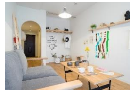
アーチタイプ室内