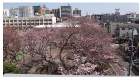
屋上からの眺望（4月下旬撮影）

屋上はウッドデッキなど木調で統一した、温かみのあるテラスを設置します。解放感あふれるテラスで360°の眺望もお楽しみいただけます。