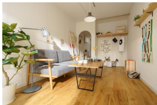
棟内モデルルーム(リノベーション後)