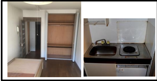
リノベーション前