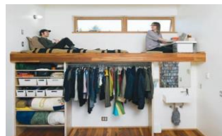
ロフト+下部収納イメージ